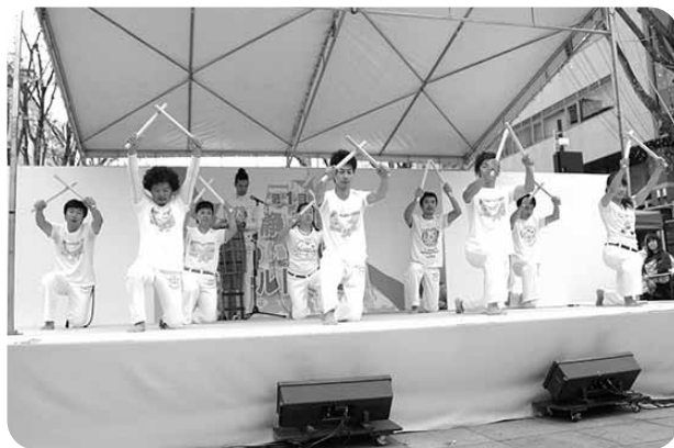
見ごたえのあるブラジルのカポエイラ （格闘技とダンス等の要素を含んだ無形文化財）

この他に、当日の運営補助をしてくださるボランティアの方がいます。その数およそ40人。また、団体出展者やリトルワールド（文化紹介ブース）講師、屋台出店者、ステージ出演者など総勢100人近くが関わっており、うち30人以上の在住外国人も参加しています。このように、日本人と外国人が協力してフェアを作り上げています。