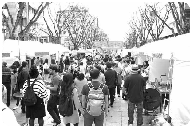
多くの方にご来場いただきました

一般市民からなる運営委員17人がおよそ一年間かけてフェアの企画と運営を行っています。