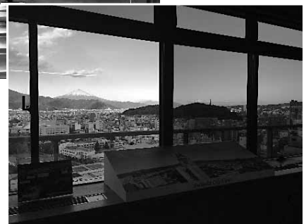
富士山のすばらしい眺望