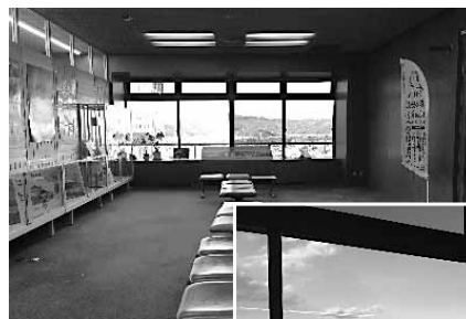
移転先となる静岡市役所17階